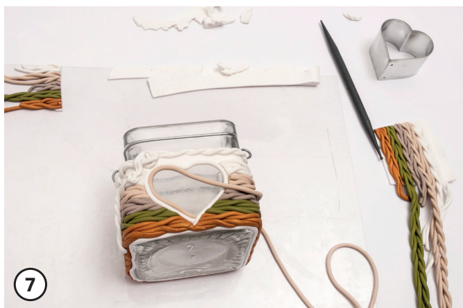
7 Ricopri il bordo del motivo con un cordoncino di Fimo.