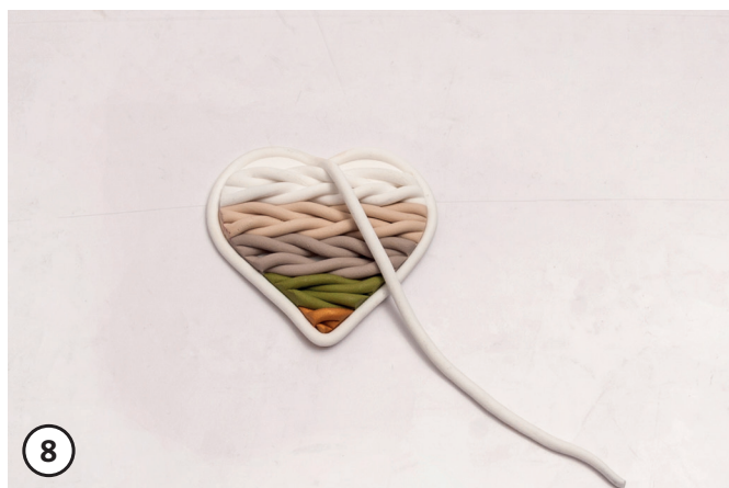
8 Metti un cordoncino intorno al cuore a maglia (Fimo) ritagliato e premi. Pratica un foro nel modello (bastoncino di legno) per appenderlo. Metti tutti i modelli Fimo su una teglia da forno con la carta da forno. Fai indurre i modelli in forno a 110° C per ca. 30 minuti. Togli dal forno, lasciali raffreddare all'aria. Il ciondolo a maglia (Fimo) può essere appeso con un nastro decorativo al vetro o ad un ramo.